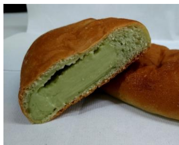
<モリヤマメロンクリームパン>