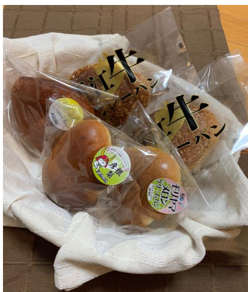
■通販サイト用ギフトの商品(イメージ)