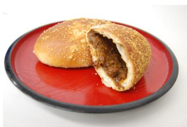
<近江牛焼カレーパン>