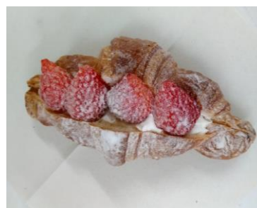
<守山いちごクロワッサン>