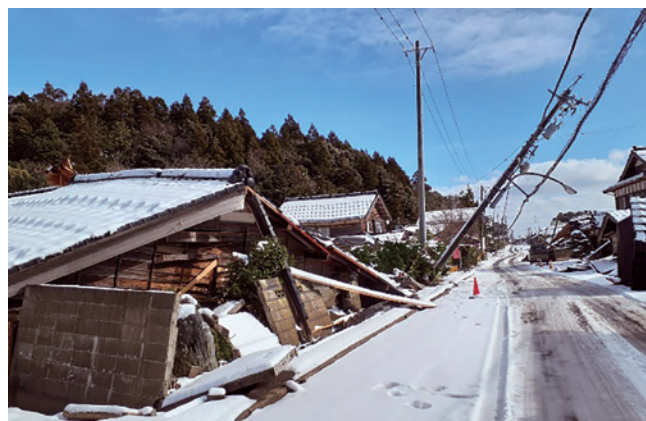
▲ 能登半島地震 珠洲市内の様子 家屋の倒壊や電柱が傾き、電線が垂れ下がっている

まさに、我が国は、災害大国といえます。この国で暮らす我々は常に災害と背中合わせの生活をしているという意識が大切です。経営者として、まずできる対策をできるところから確実に実施しておく必要があります。その第一歩として、災害対策のチェックとともに災害時における情報収集と伝達について取り組まれてはいかがでしょうか。