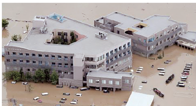
▲西日本降雨災害 倉敷市 真備記念病院の様子 ハザードマップでは浸水が想定されていた

ハザードマップなどで自社がこういった特徴のある地域に立地しているかを評価し、それを考慮した会社独自の防災対策を検討していく必要があります。