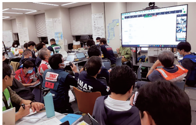
▲ 能登半島地震 石川県庁保健医療福祉調整本部各拠点との情報共有ミーティング(WEBを活用)

特に初動では、会社として対応の方針決定のための情報収集となり、それらを関係部局に伝達することとなります。