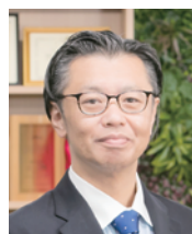
ウイングアーク1st株式会社 データのじかん主筆

「自分のために開発したツール」の象徴的なエピソードとして、スマートスピーカーによる応援機能があります。業務終了時に薬剤師がスマートスピーカーに向かって「ありがとう」と言うと、「お仕事頑張ってくださいね」と答えるものです。毎月この地道な業務を行っているのに誰にも褒められなかったが、このスピーカーに初めて応援してもらえたと感じる薬剤師が多くいたそうです。もしシステム開発会社に外注して、見積額が高いと感じたら真っ先に削られる機能ですが、薬剤師が開発し薬剤師が評価するとこの機能が実装されるのかと気付かされ、現場で使う人が開発する意義を改めて感じました。(この事例は筆者取材時のものであり、現在では異なる場合があります)