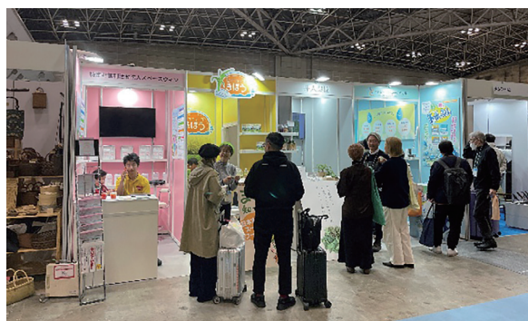
▲東京ギフトショー出展