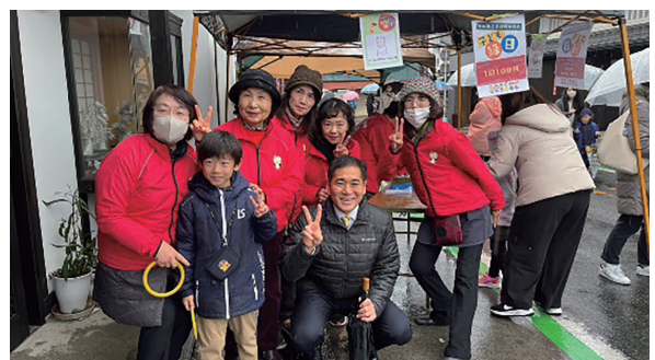
▲もりやまいち出店事業