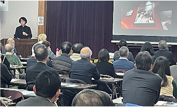
▲ものづくり講演会