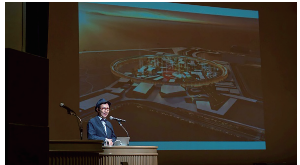
▲ビジネスアカデミー