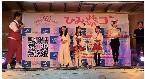
▲ひみこコンテスト