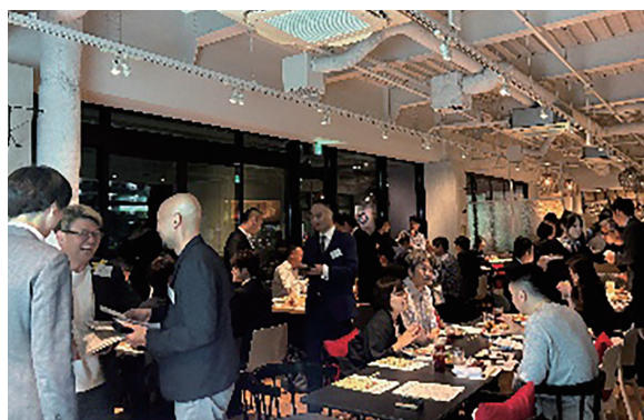
▲ビジネスマッチング大交流会