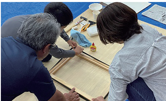
▲親子ものづくり教室