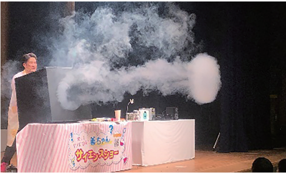
▲善ちゃんのサイエンスショー