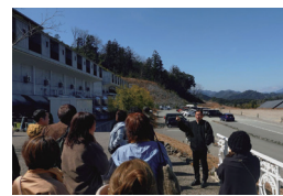
▲現地ガイドの解説を聞く参加者ら

その後、伊勢神宮を訪れ、参加者らは平日でも多くの観光客でにぎわうおかげ横丁の商売の様子等を見学された。