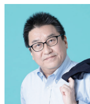
地域経済アナリスト コンサルタント

「重い」と並んでもう一つの短所である「高い」という点については、ある種の趣味の道具であるという位置付けで提案しています。いわばゴルフクラブや釣りざおと同じようなポジションにフライパンを持ってきたのです。趣味の領域なら高価であっても「道具から入る」人も多くいます。こうしたさまざまな提案や工夫を練り出すことによって、短所を逆に長所へと転換するよう位置付けを変えたのが、この商品の成功の秘訣（ひけつ）であるといえます。