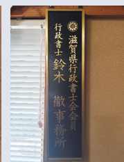
▲行政書士も されています