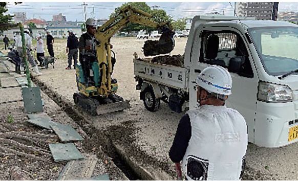
▲集中豪雨水害防止奉仕事業